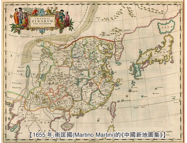
【1655 年，衛匡國(Martino Martini)的《中國新地圖集》】

李兆良於俄亥俄州哥倫布市 (2014 年 4 月 1 日原創，4 月 3 日修訂)