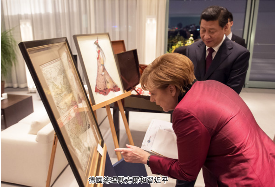
德國總理默克爾和習近平

他是收集了別人的地理知識而已。據說原作有地圖，但是已經失佚，可能根本從來沒有。托勒密的