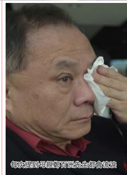
每次提到母親鄭百洲先生都會流淚

採訪最後我問他有沒有遺憾與難受的事情發生？他說有的時候接生在母親肚子裏的死要，我們整個病房都會難