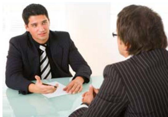
作者:美安東尼·詹康欣葉譯