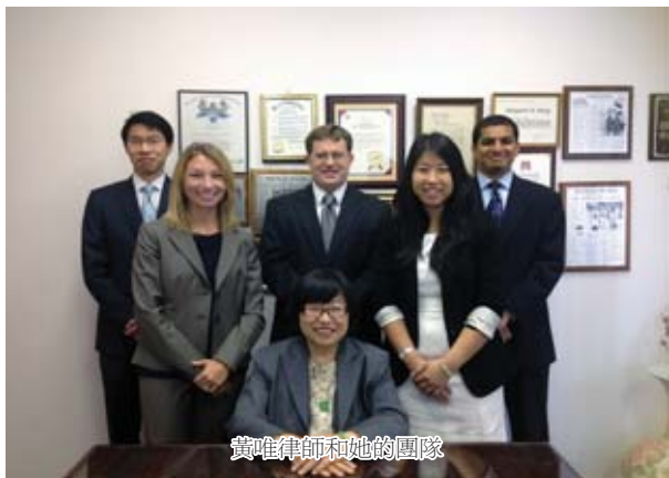
黃唯律師和她的團隊