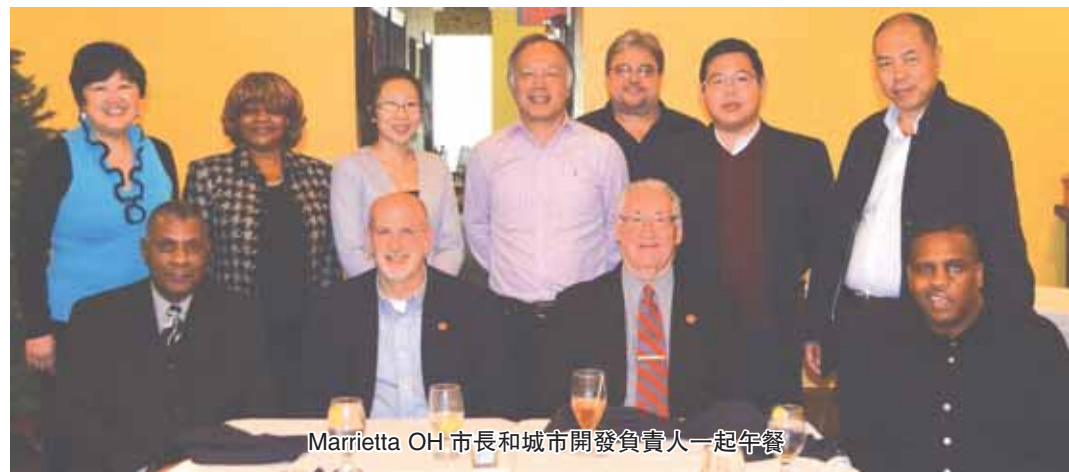
Marietta OH 市長和城市開發負責人一起午餐