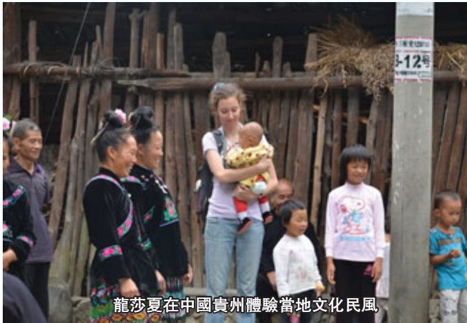
龍莎夏在中國貴州體驗當地文化民風