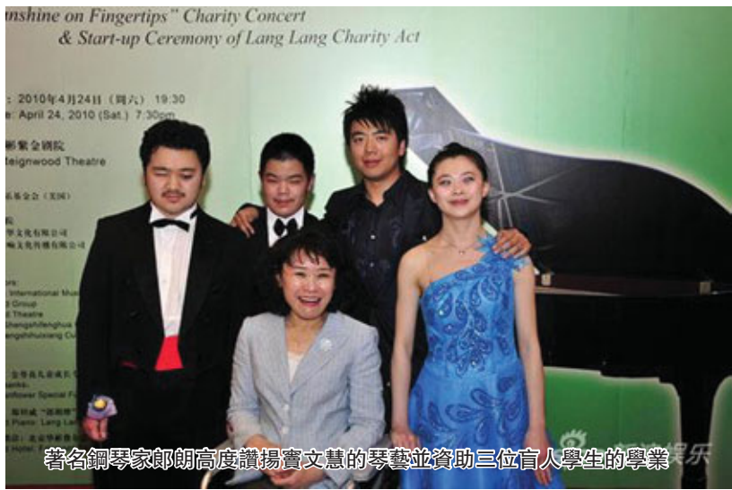
著名鋼琴家郎朗高度讚揚寶文慧的琴藝並資助三位盲人學生的學業

TCU，雖然生活上有很大的困難，但我覺得還可以忍受，最主要的是經濟上的壓力使得我喘不過氣來。來這之前我考慮的比較簡單，認為經濟上的困難我可以通過勞動來幫助解決一部分，哪知道我是不可以工作的。我每天都在精打細算，可生活上的支出相對而言佔整個支出的比例還是一小部分，主要是高昂的學費，其次是房租費。這些給我造成了很大的精神負擔，內心很壓抑，也很苦悶，沒有一點兒快樂。