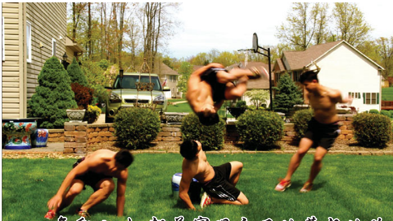
舞動人生 朝着實現自己的夢想的路勇往直前