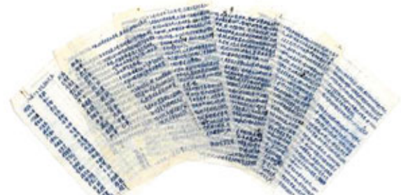
張學良陪同蔣介石回南京,在飛機上寫的「絕命書」(八頁):

周聯華牧師主辦的東海大學圖書館後,將其他重要文物,如手札、信函、字畫、照片、日記等,都在等人整理裝箱後,悄悄運往美國紐約。