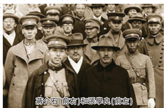
蔣介石(前右)和張學良(前左)