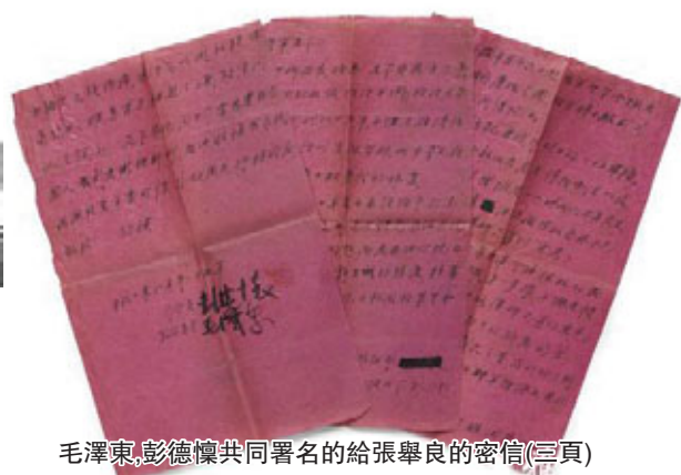
毛澤東、彭德懷共同署名的給張學良的密信(三頁)