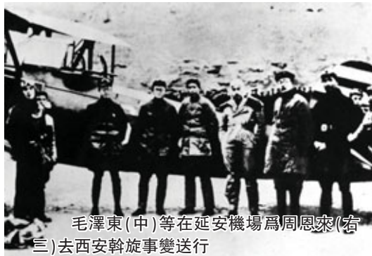
毛澤東(中)等在延安機場為周恩來(右三)去西安斡旋事變送行