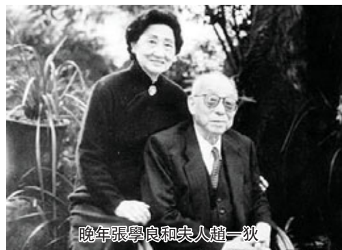
晚年張學良和夫人趙一荻