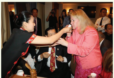
美國嘉賓聞中國茶香