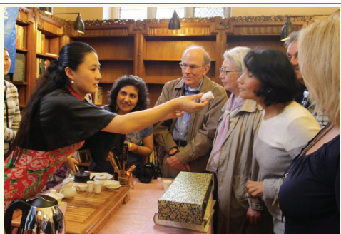
耶魯大學師生為中國茶香所陶醉

“全球華人的驕傲”,在美國社會享有崇高的聲譽,李博士的表彰,也是給海峽兩岸茶業交流協會代表團的榮譽。李昌鈺博士是世界首席刑偵大師,被各國警界同仁譽為當代“福爾摩斯”。他是美國家喻戶曉的明星偵探。由於他屢破大案,奇案,成了犯罪克星,也成了美國人的保護神。據說,有人為了能得到一張他的名片作“護身符”,竟出價35美元。當我們離開刑偵學院,走到門口時,李昌鈺幽默地說,“安溪鐵觀音如果放在我們學院大門做廣告,我是很願意啊!”是啊,憑藉李昌鈺的威名,憑藉刑偵學院的地位,這是能讓鐵觀音廣告佔有一席之地,鐵定鐵觀音暢銷啊!