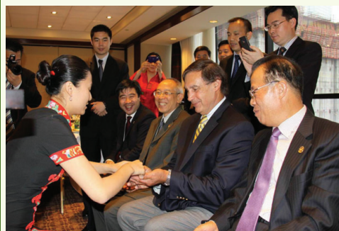
茶藝女演員請美國茶業協會主席約瑟夫·西姆拉尼(右二)品茶

5月23日晚,在美國耶魯紐黑文飯店19樓景觀廳,來自耶魯大學和康州的二十多名流欣賞茶藝表演。在後面觀賞鐵觀音茶藝表演的美國客人,都不知不覺擠到前麵茶藝表演台,向兩位演員學習茶藝表演中翻轉聞香杯倒扣在茶杯的動作,直到學會才笑着離開。大家開心地笑着品着。在電梯口守望的保安員,聞到從景觀廳里飄出的陣陣茶香,按捺不住渴望的心情走到門口討了一杯茶,心滿意足地細細品起來。