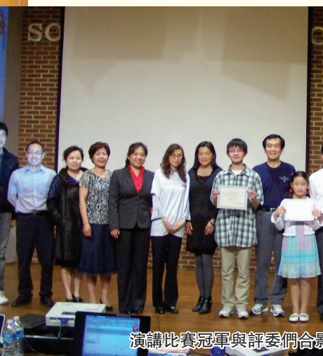
演講比賽冠軍與評委們合影留念

了評委和觀眾,獲得了即興演講比賽的冠軍。有些選手因為超時,沒有得到名次,非常可惜。希望他們明年能有更好的表現。