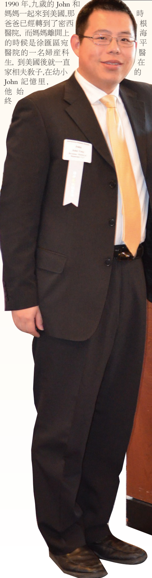
BRENNAN, MANNA & DIAMOND ATTORNEYS & COUNSOLRS AT LAW

業，華人在政治領域，藝術和文學界更是寥寥無幾。我們踏上美國土地時的幻想憧憬和雄心壯志代替了內心深處失去親情友情和遠離祖國家鄉的失落，隨着時間的推移，這些心靈與情感上的痛苦和其它美好的回憶都讓我們一起存放在記憶的角落。 今天我來要給您介紹的這二位年輕人都是出生在中國，雖然各自有不同的家庭背景，但他們的父母親都是第一代來美，他們走自己的路，他們有共同點：真誠孝順，敢於探他們目睹，想證明他們自己的能力。