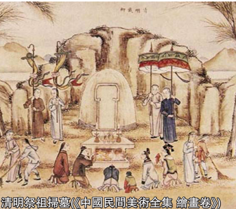
清明祭祖掃墓(《中國民間美術全集 繪畫卷》)

當今，社會上逐步興起鮮花祭掃、手機短信祭掃、網上掃墓等祭奠新風尚。特別是在科技日新月異的當代，互聯網使人們可以足不出戶就能掃墓。有的年輕人在網頁上為去世的親人設專頁，將照片等有關資料放上去，寫上追思懷念的話語，清明前後就上網打開網頁，遙寄心香一瓣，形式也有了，心意也有了，這種省時又省力的新興祭奠方式受到人們的歡迎。