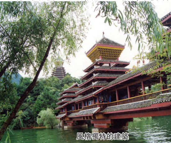
貴州省首府貴陽市