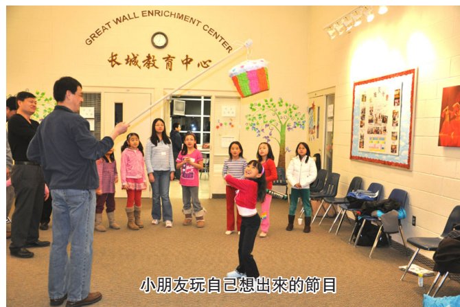
小朋友玩自己想出來的節目

媽媽俱樂部總是有意思的很多活動，幾乎每月都有不同的活動。近半年來更增加了讀書茶話會。周末，聚在溫暖舒適的家里，吃小點心，喝點茶或葡萄酒，聊聊