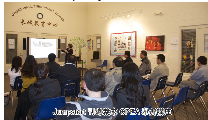
Jumpstart 副總裁來 CPEA 舉辦講座