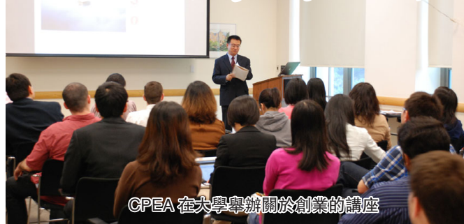
CPEA 在大學舉辦關於創業的講座

幾年來，CPEA 一直努力為在美華人，尤其是大克利夫蘭地區的華人帶來最新的職業與投資的各種信息。