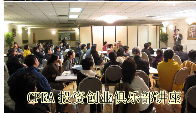
CPEA 投資創業俱樂部講座