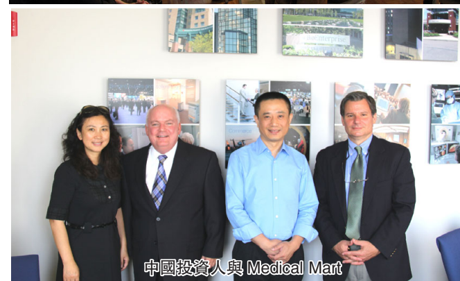
中國投資人與 Medical Mart