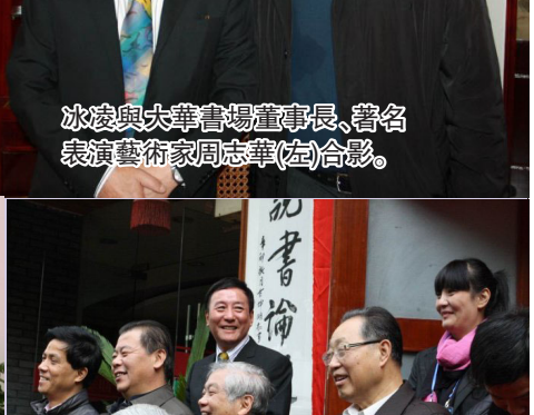
冰凌與大華書場董事長、著名表演藝術家周志華(左)合影。