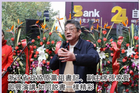
浙江省政協原黨組書記、副主席孫家賢即興演講,如同說書一樣精彩。