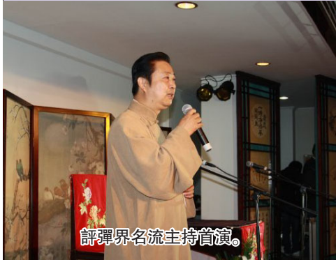
評彈界名流主持首演。