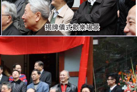
揭牌儀式歡樂場景。