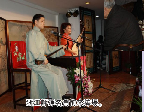
浙江評彈名角前來捧場。