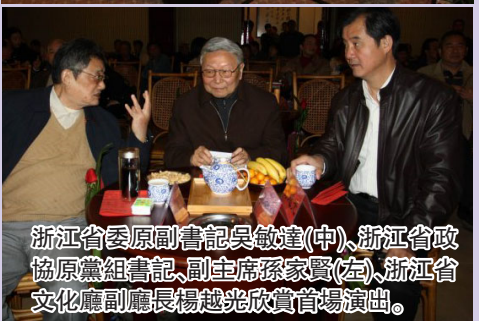
浙江省委原副書記吳敏達(中)、浙江省委原黨組書記、副主席孫家賢(左)、浙江省文化廳副廳長楊越光欣賞首場演出。