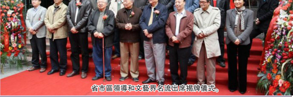
省市區領導和文藝界名流出席揭牌儀式。