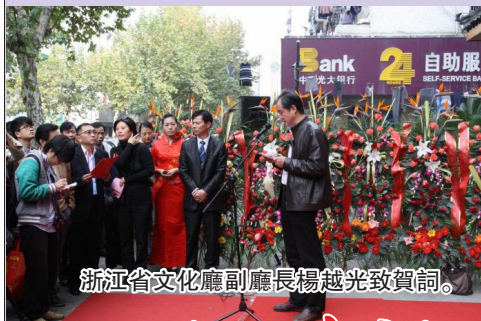
浙江省文化廳副廳長楊越光致賀詞。