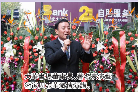
大華書場董事長、著名表演藝術家周志華激情演講。