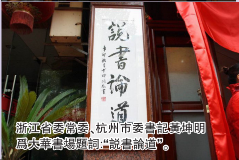
浙江省委常委、杭州市委書記黃坤明為大華書場題詞:“說書論道”。