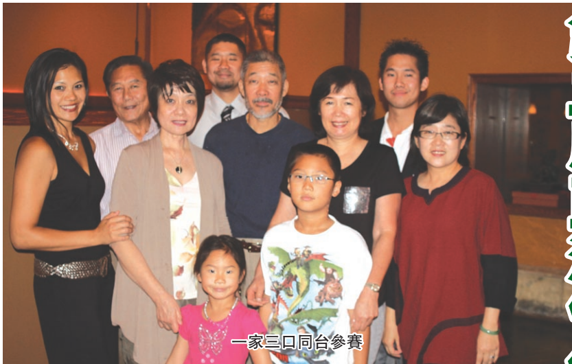
一家三口同台參賽