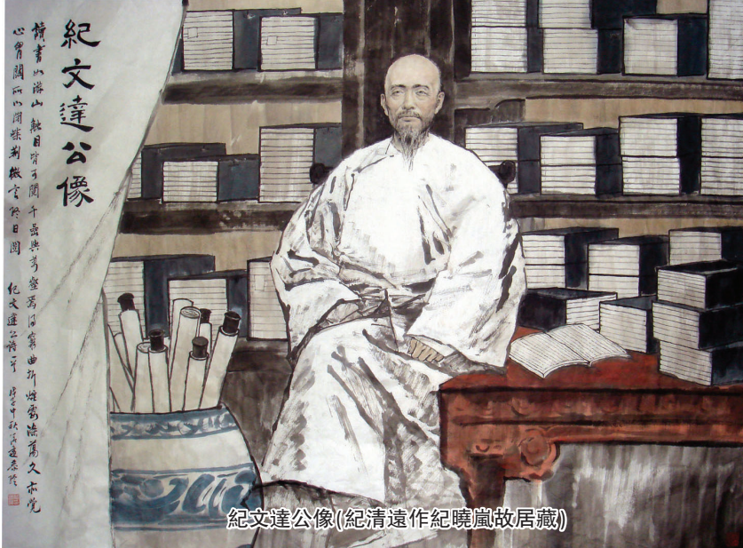
紀文達公像(紀清遠作紀曉嵐故居藏)