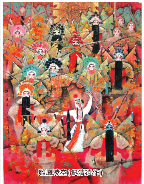
雛鳳凌空(紀清遠作)