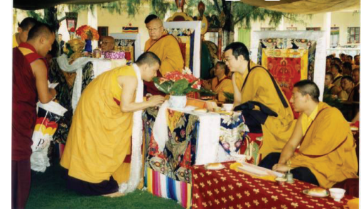
作者: 蔣康祖古仁波切 印度最大寧瑪佛學院 白玉南卓林寺住持