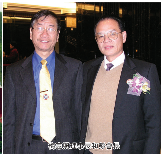
梅惠照理事長和彭會長