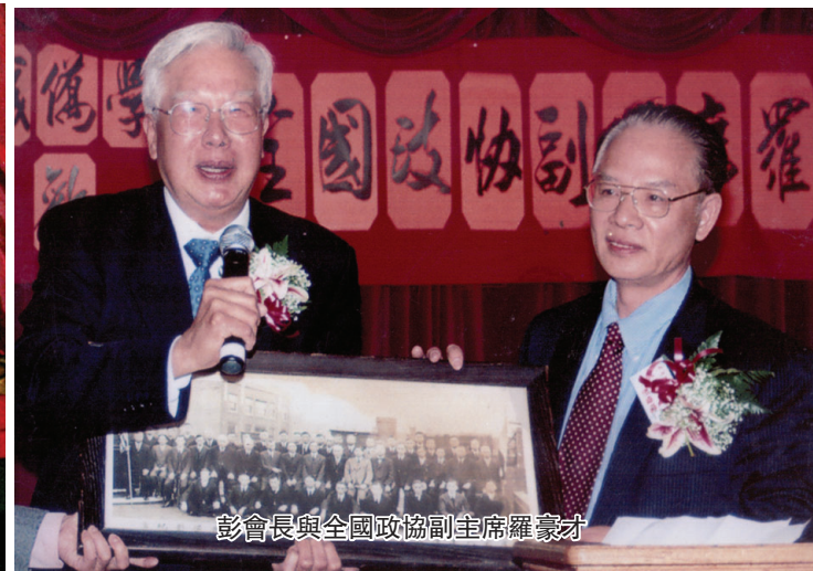
彭會長與全國政協副主席羅豪才