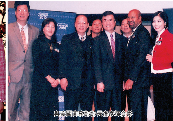
與美國商務部長洛家輝合影