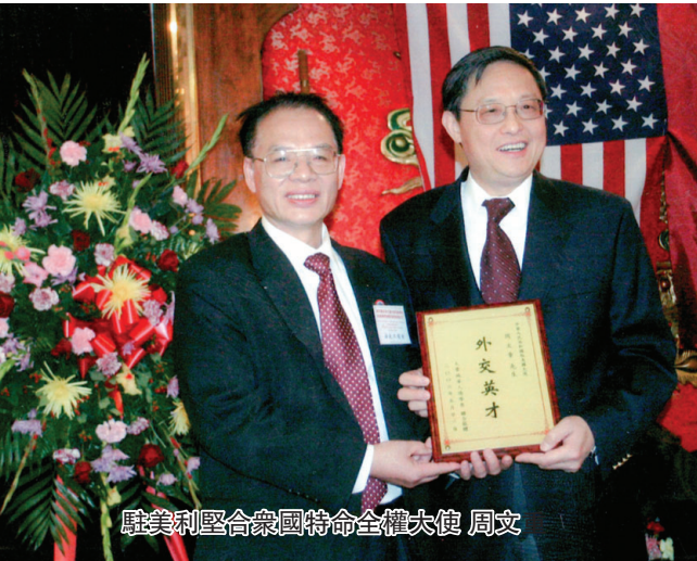
駐美利堅合眾國特命全權大使 周文

彭偉權先生是一個聰明人，因為他看得懂事與物；他看到歷史的巨輪總是朝一個方向行，彭偉權也是個生意人，因為他精明，做事看準再做，彭偉權又是一個有遠見人，他是一個智慧人，他看得很遠，他知道世界孫中山基金會會像一個中心，繼續凝聚和點亮周邊人，因為是孫中山先生的精神“振興中華”為中華民族和中國人民樹立了博大精神和愛國情懷。