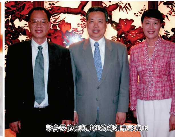
彭會長與駐紐約總領事彭克玉