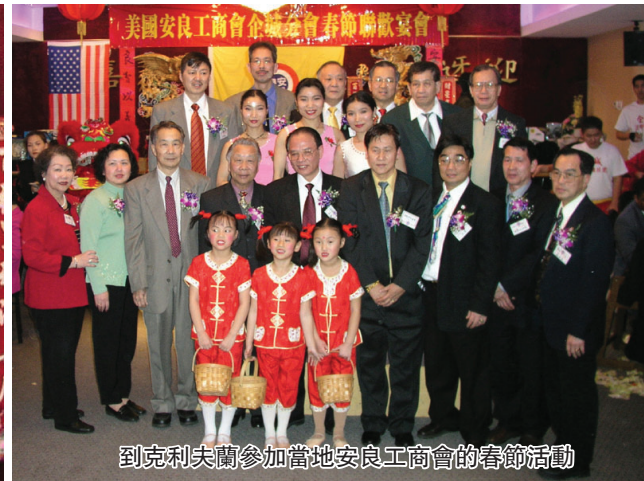
到克利夫蘭參加當地安良工商會的春節活動