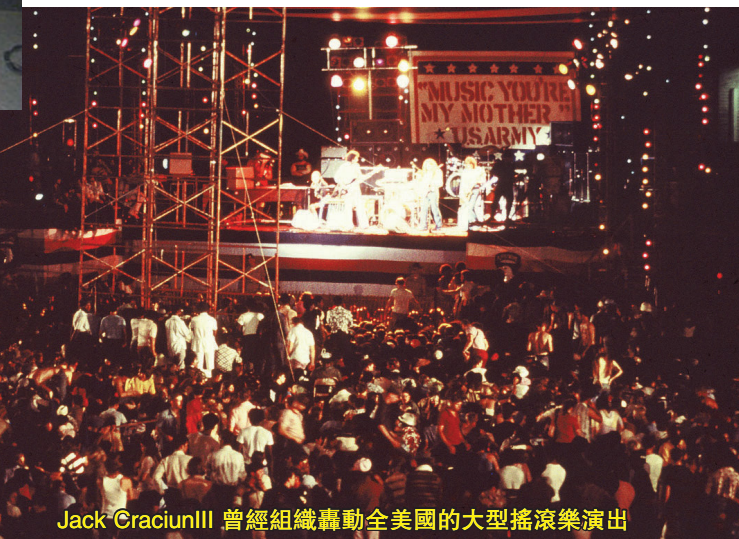
Jack Craciun III 曾經組織轟動全美國的大型搖滾樂演出

到了 50 年代中期,這批青少年由於生活條件優越,沒有像父輩那樣經歷過戰爭和苦難,同時又倍受家庭的寵愛,因此,他們開始不理解父母們的思維和生活方式,不願意走父母為自己安排好的道路。他們有了自己的追求和愛好,而且由於人多勢眾,形成了一股強大的力量,他們不再跟隨父母欣賞那些多愁善感的流行歌曲。這時,他們正好在搖滾樂中找到了自己的聲音。搖滾樂簡單、有力、直白,特別是它那強烈的節奏,與青少年精力充沛、好動的特性相吻合;搖滾樂無拘無束的表演