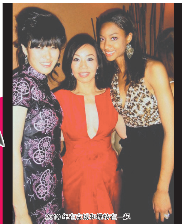
2010年在克城和模特在一起

精力，有能力財力，她自信在未來的五年里，她將要把她的高級服裝打造成國際品牌，還打算五年股票上市，另外目前她已經看上一套從花朵中提煉出來的系列自然化妝保養品，她也打算