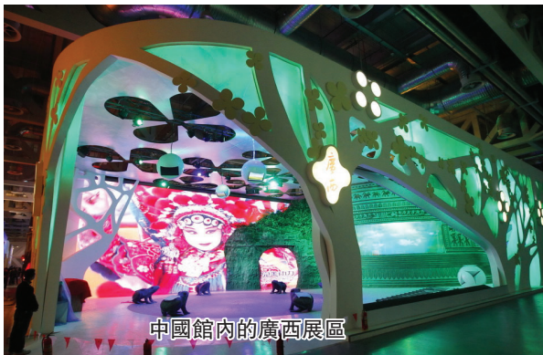
中國館內的廣西展區

在英國館的相關點評中，雖然支持者不少，但質疑聲也是此起彼伏。不滿意的遊客認爲，在英國館獨特的外型下，館內的設計卻如此簡單，似乎有些“徒有其表”。不過馬上就有忠實的“粉絲”來“反擊”：“英國館的主題爲種子，所展出的全部都是瀕臨滅絕的稀缺品種，雖然不及有些場館內設計那么炫目，但是展示的人與自然的和諧正是代表了此次世博會的理念。”