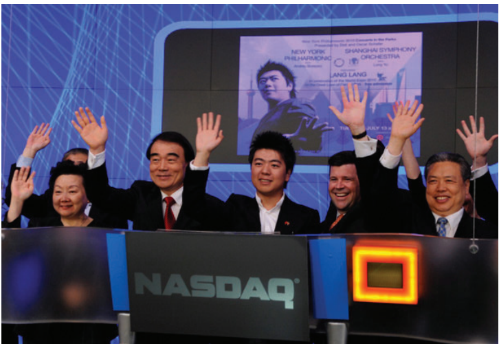
7月2日，在紐約納斯達克電子交易大廳，中國常駐聯合國代表李保東（前左二）、中國駐紐約總領事彭克玉（前右一）、上海世博會形象大使郎朗（前左三）、納斯達克 OMX 集團高級副總裁羅伯特·麥柯奕（前右二）出席開盤敲鐘儀式。

帝國大廈正在舉辦慶祝上海世博會的櫥窗展。本月13日，朗朗與上海交響樂團、紐約愛樂樂團將在中央公園聯合舉辦紐約公園系列交響音樂會，這是兩家樂團首次聯合參加紐約夏季公園演出。