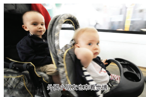
外國小朋友也來看世博

一個地球，擔負起我們的責任”，活動圍繞氣候變化與青少年擔負的責任展開，寄語青少年作爲城市未來建設者應不忘關注環境變化與自身的責任。 活動由博覽會組委會和世博會城市最佳實踐區部共同組織，來自中國上海、香港、澳門以及新加坡、泰國、馬來西亞、印度、愛爾蘭、法國、意大利、德國、英國、美國、新西蘭、澳大利亞、南非和墨西哥等國家和地區的青少年，將接受由城市最佳實踐區頒發的“城市未來實踐者”證書，其中7個國家的城市最佳實踐區負責人還將與所在國家的青少年結對交流。 本屆青博會主題爲“世博·科技·創新·未來”，來自17個國家的30多所中學的青少年學生將圍繞科技創新與美好生活、科技創新與未來城市、科技創新與應對氣候變化等內容開展交流和展示活動。