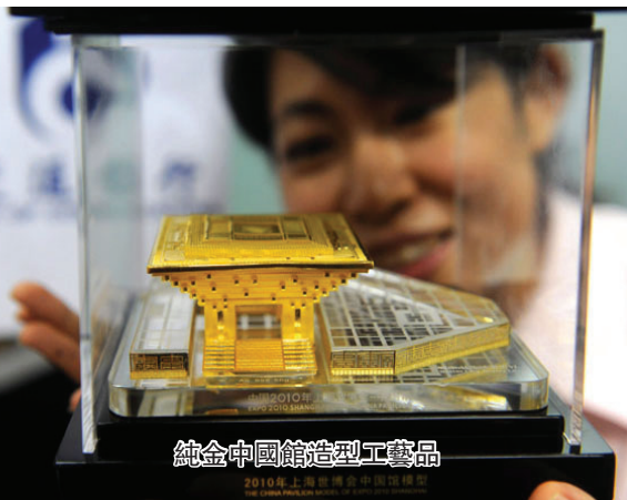
純金中國館造型工藝品

同時，今年恰逢紹興市承辦有合唱界“奧林匹克”美譽的“第六屆世界合唱比賽”，來自80多個國家和地區的480多支合唱團共計2萬