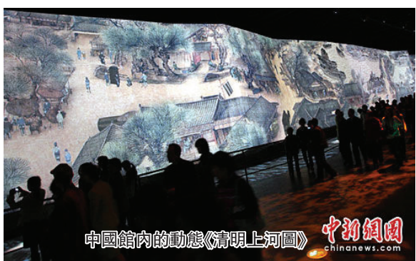
中國館內的動態《清明上河圖》

開園兩個月，前來參觀世博會的遊客超過兩千萬，除了現場參觀風格各異的世博場館，意猶未盡的遊客們還在網上留言點評，支持自己中意的展館。