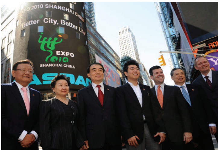
7月2日，在紐約納斯達克電子交易大廳，中國常駐聯合國代表李保東（左三）、中國駐紐約總領事彭克玉（右二）、上海世博會形象大使郎朗（左四）、納斯達克 OMX 集團高級副總裁羅伯特·麥柯奕（右三）在納斯達克慶祝上海世博會舉行的電子顯示屏前合影。