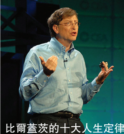
比爾蓋茨的十大人生定律