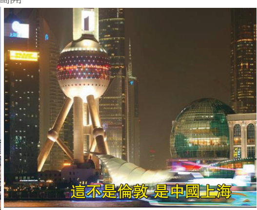
這不是倫敦 是中國上海