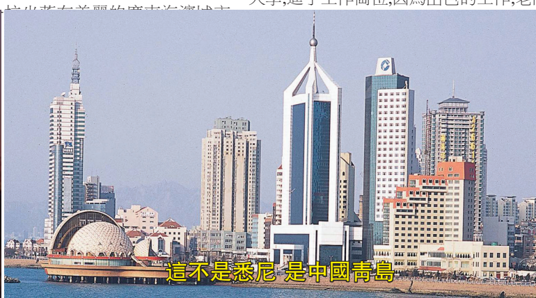
這不是悉尼 是中國青島