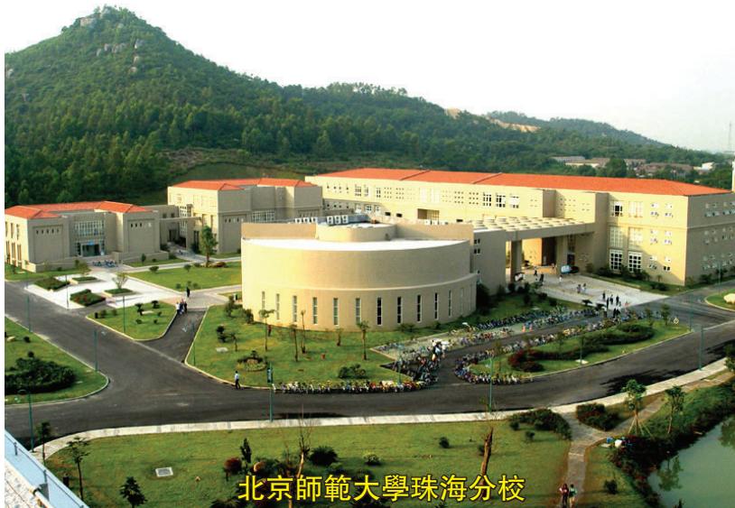
北京師範大學珠海分校

雖然今天的中國是海歸們創業的最佳選擇，但海歸們必須要首先學會在不同的社會背景和環境中及時調整自己的心態，儘快找到自己的位置，只有这样才能使得與祖國久違了海外赤子們攀上中國這列飛速前進的列車，與祖國同步向前發展，並在次基礎上開拓自己的事業。當今的中國在世界上的地位已經可以讓每一位華人深感自豪；中國是外匯存底世界第一；中國是石油消耗世界第一；中國是貿易金額世界第一，而中國城市的地圖，每三個月就要改版一次，才能趕上建設的腳步。我們都一樣，都生活在同一個地球上，頭上是天，腳下是地，窮人富人都曬一個太陽，跟着你的心走，路一定會寬。在此我代表伊利華報和華報的讀者祝王建成先生的事業不斷發展，為提陞祖國的教育事業與海外的大學搭建更多的橋樑。