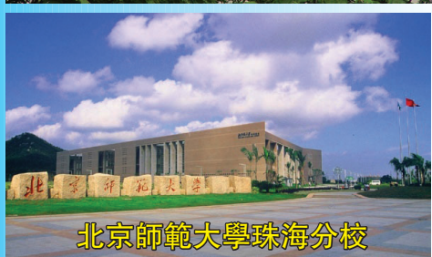
北京師範大學珠海分校