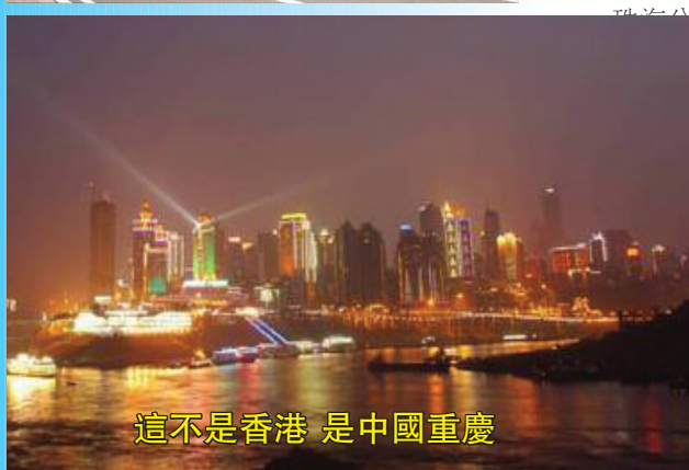
這不是香港 是中國重慶