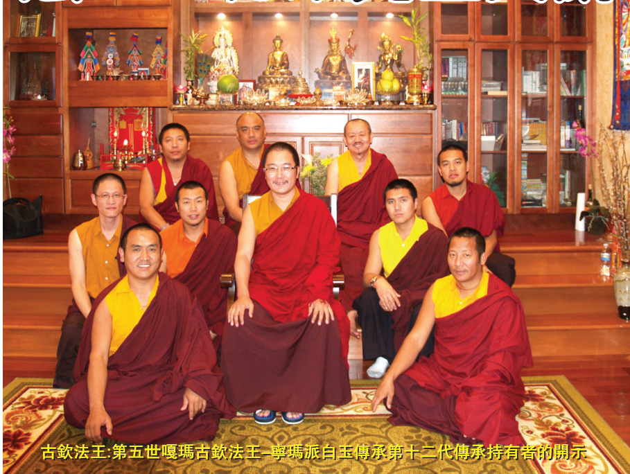
古欽法王、第五世嘎瑪古欽法王 - 寧瑪派白玉傳承第十二代傳承持有者的開示

個非常好的緣起，佛教的教理是非常精博深奧的，如果你們能持續的聽聞與修學是非常好的事情，最好不要半途而廢，那會是很可惜的一件事。