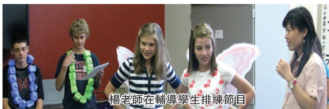
楊老師在輔導學生排練節目

時間過得真快,再有兩天夏令營就要結束了。目前同學們正處於最後冲刺階段,精彩節目也在緊鑼密鼓的排練中。屆時會向學生家長彙報,並饗讀者。