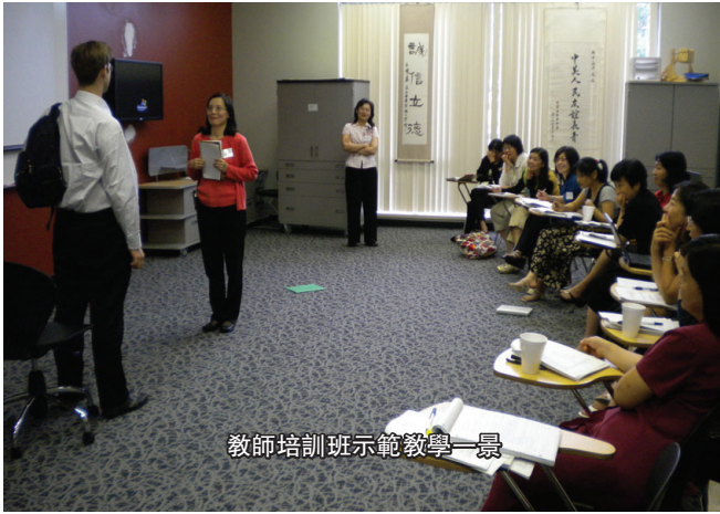
教師培訓班示範教學一景

俄亥俄州立大學中文旗艦中小學項目以不同的方式為開設中文的中小學校提供技術支持。具體請登陸查閱: http://k12chinese-flagship.osu.edu (如有疑問,請聯繫 shi.7@osu.edu)。