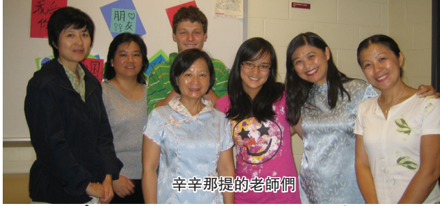
辛辛那提的老師們