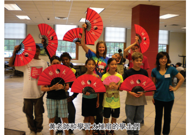
黃老師和學習太極扇的學生們

每天早晨我們都會一起唱“找朋友”。然後我們一起邊數邊做早操,大家都變得很有精神。在上課前所有營員都會以前背誦口號。吃完午飯後我們會一起坐下,做每個中國學生會做的眼保健操。