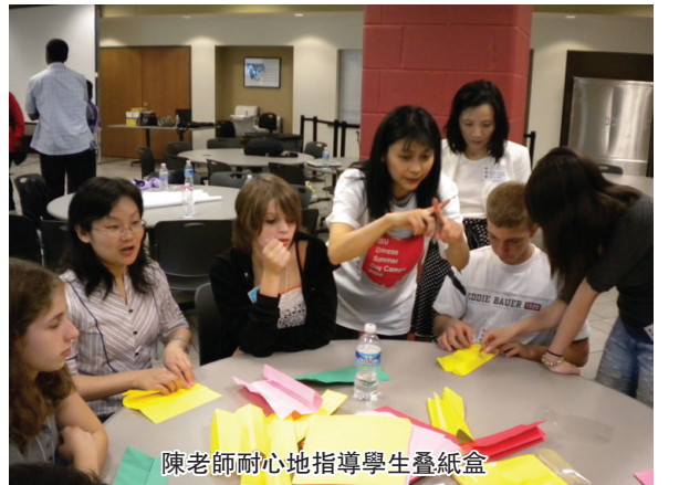
陳老師耐心地指導學生疊紙盒

當然除了在通過吃喝活動大部分的學習還是在上課時學的。從第一天到現在真的學了好多。學了自我介紹,介紹別