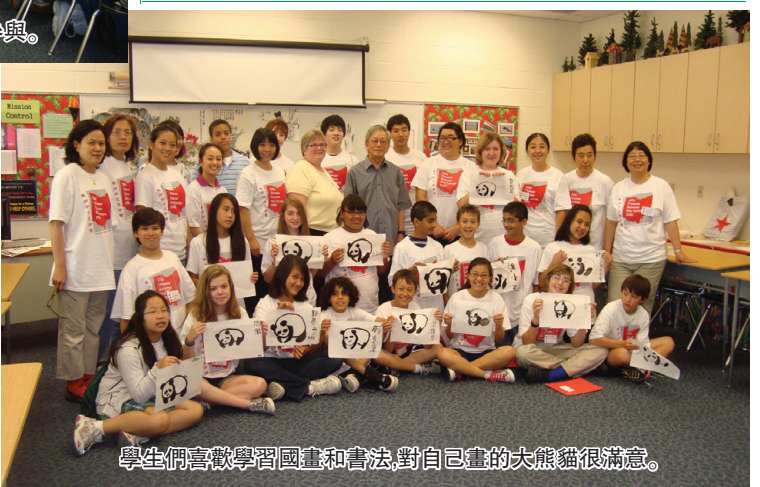
學生們喜歡學習國畫和書法,對自己畫的大熊貓很滿意。

就在這一個一個活動里營員們學會了中文。也對中國文化有了新的一層認識。早操和眼保健操更讓他們體會了中國學生每天在學校的一部分。我相信這幾天的經歷會成為這些營員們人生里一個美好的回憶。通過政府對中文教育的支持和多元文化的尊重與重視讓我們大家感受到美國的平等與自由。(克里夫蘭的營地再 Shaker Heights 高中。)