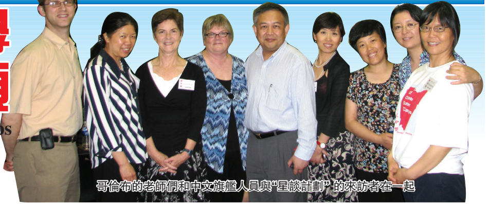
哥倫布的老師們和中文旗艦人員與“星談計劃”的來訪者在一起

在聯邦“星談計劃”(StarTalk)經費的支持下,俄亥俄州立大學東亞系和中文旗艦中小學項目于六月十七至三十日在俄州四大城市(哥倫布、克里夫蘭、辛辛那提和代頓)同時舉辦了第二期中學生夏令營。我們再次與當地高中和華文中學學校合作,招收了近90名中學生,配備了12名教師和21名同齡華裔輔導員,外加協調員和助理的支持。今年的夏令營加強了對教師和輔導員的培訓,改進了教學內容,將為推動全州的中文教育起到更大的作用。