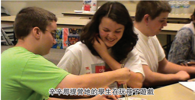
辛辛那提營地的學生在玩撲克遊戲

夏令營除了完成規定的日常語言學習,還安排了豐富多彩的文化活動。其間,營員們饒有興趣地學做中國結、學寫毛筆字、學剪紙,輔導員們還教營員們如何下中國象棋、圍棋,而茶道表演更讓他們親眼目睹了中國文化的神奇。下周他們還將用所學漢語體驗下館子用中文點菜、逛超市用中文購物的樂趣。