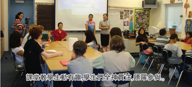
課堂教學生動有趣,學生們全神貫注,踴躍參與。