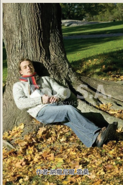
作者:納撒尼爾·霍桑