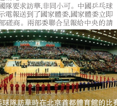
美國乒乓球隊訪華時在北京首都體育館的比賽現場

動，更深深觸動了美國隊的副領隊，他立即來到中國隊的駐地，問中國隊的負責人：「你們中國邀請我們南邊的墨西哥隊去訪問，也邀請我們北邊的加拿大隊，你們能不能也向我們美國隊發出邀請呢？」