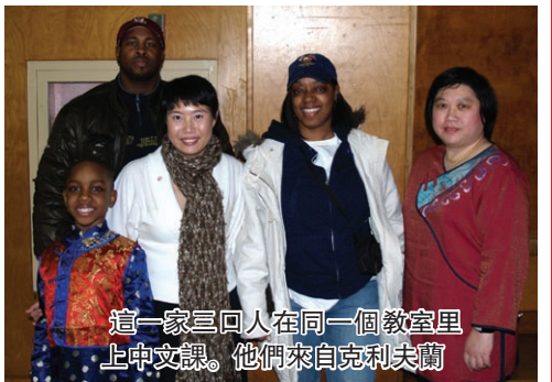
這一家三口人在同一個教室里上中文課。他們來自克利夫蘭

一場聲勢浩大而壯烈的赤壁之戰及十二生肖,每位小朋友的自我介紹再再的顯示小朋友學習能力之好,除了讓觀眾席爆發出熱烈的掌聲外更著實讓慕名而來的觀眾們上了一堂文化課。不同年齡孩子的表演各有特色,年齡大的靠動作優美取勝,三、四年級的手語歌有美有愛讓所有的人心感動,而幼稚園年齡小的則以可愛活潑的動作贏得台下的掌聲,一首中國娃娃來拜年,又是扭腰又是擺臀讓台下的人笑的不可自拔。有的小朋友上台時太過緊張,整個表演過程中既不動亦沒有表情,直到表演結束才終於露出如釋重負的可愛微笑,贏得台下觀眾的熱情掌聲鼓勵。由 Shaker Height school 所帶來的讓愛住我家突顯了中華文化孝順及愛的美德。CSL 班來自於母語非中文的一群好學學子,不同膚色的他們一身喜氣洋洋傳統的中華服飾舞唱出慶餘、新年好有著中西融合獨特的神態更表現出他們努力學習的成果。最後的手牽手大合唱由同學、老師家長們唱出我們都是一家人心聲。當由家長組成的義工們笑容滿面的帶領下,每位嘉賓皆在手中有著美味可口的佳餚,豐富的餐點中入座餐廳,高聲談論著今晚的精采,好不熱鬧。