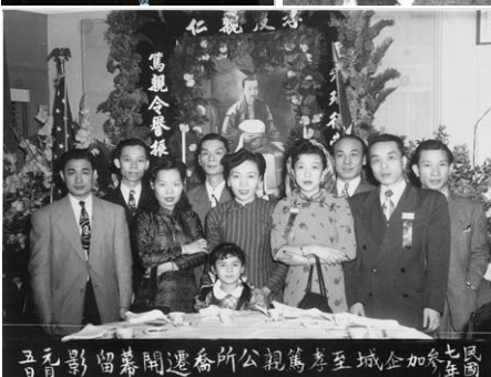
▲長青大廈開幕左起第一人主席麥芝慶博士，第三人國會議員路易·斯托克斯，右起第一人建築師陳志堂。