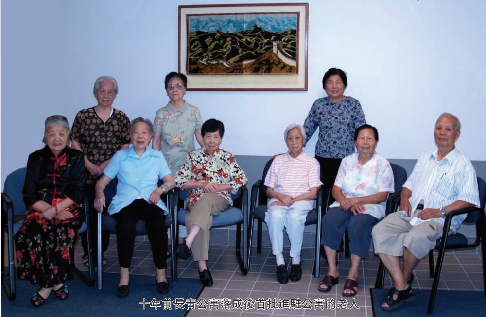
十年前長青公寓落成後首批進駐公寓的老人

新公寓新居民， 安樂窩十春秋。 鄰舍親同移民， 互關照貼人心。 緣情深感情厚， 同歡樂壽星影。