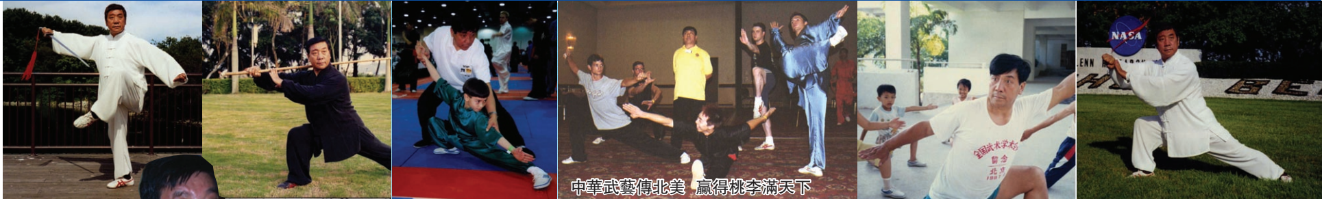
中華武藝傳北美 贏得桃李滿天下