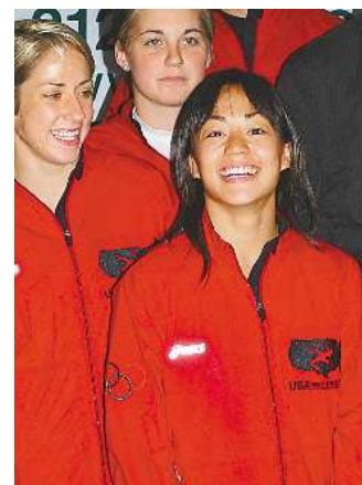
陳美玲是美奧運摔跤隊里身材嬌小、作風強悍、笑容燦爛的明星 據美國《世界日報》報道，在夏

威夷出生的華裔美國摔跤選手 (Clarissa Chun)，近日奪得全美奧運選拔賽冠軍，將代表美國參加北京奧運會自由式摔跤 (freestyle wrestling) 的 48 公斤級比賽。在 6 月 19 日亮相紐約的美國奧運摔跤隊成員中，嬌小玲瓏的陳美玲頗引人注目，她毫不掩飾對奧運獎牌的渴望。