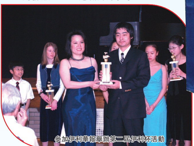
參加伊利華報舉辦第二屆伊利杯活動