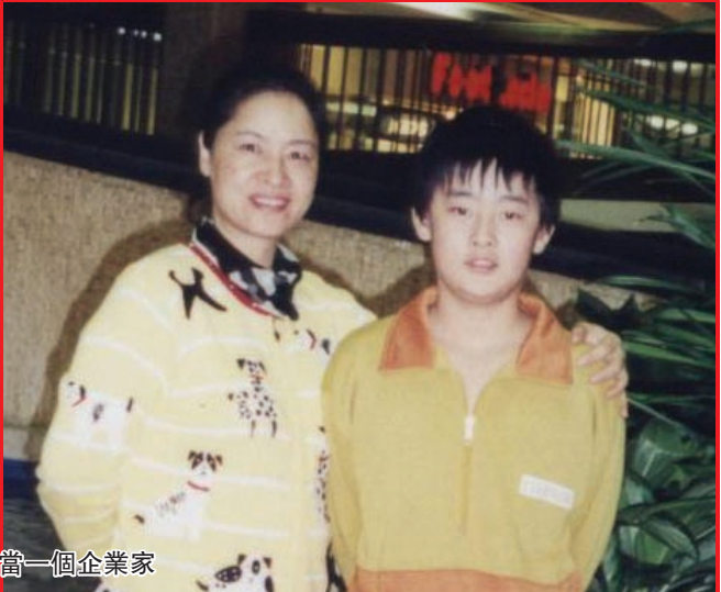
母子情深，從小就是一個聽話愛獨立的小孩，他從不要父母操心，長大立志要當一個企業家