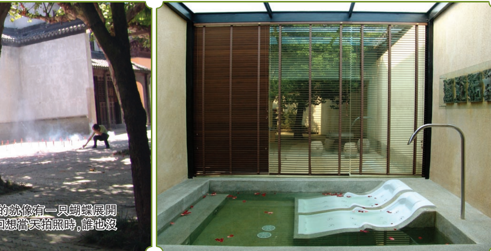
這張不起眼的照片中正中間,竟出現了一隻彩蝶的幻影,濛濛飄飄的就像有一隻蝴蝶展開了翅膀從絲業會館的大門里翩翩飛出,在空中展示着它絢麗的色彩。回想當天拍照時,誰也沒有看見照片上的那只蝴蝶,它是來自另一個世界的蝴蝶嗎?

星巴克(Starbucks)咖啡 20 世紀 70 年代,在美國、歐洲喝咖啡還是根深蒂固的一種家庭消費習慣,人們都還習慣于在辦公室和家里煮咖啡。而城市里的咖啡館絕大部分都屬於自發的、分散的、小打小鬧式的自然增長方式發展,在廣闊的咖啡館市場面前,這一切都顯得那么蒼白無力。1971 年,星巴可在西雅圖平民的傳統市場區誕生。1996 年,星巴可正式跨入國際,現在更以每一天這個地球上就多了 3.4 家星巴可的速度成長。這個發展歷程,就像企業版圖變鳳凰的傳奇。正是因為星巴可的崛起,越來越多的美國人認識了泛著濃厚奶香的拿鐵,越來越多的美國人習慣在星巴可里小坐。可以說,星巴可造就了整個世界範圍內的咖啡館市場。對於星巴可的成功,最主要的原因只有兩條:一是星巴可善於吸引消費者,這是咖啡館的生意來源;二是星巴可善於管理,這是星巴可能夠迅速擴張的根基。在短短不到三十年的歷史僅在全球開了 6000 家連鎖店。星巴可的特點第一是選址。它設在最繁華的商業區域,這大大有利於吸引商務消費者和情侶消費者這兩大類消費群,由於這兩類消費群本身就屬於時尚的製造者和追逐者。因此我們經常可以看到在星巴可里有人在使用最新流行的手機接電話,有人在用最新款的筆記本電腦無線上網,這種店內風景就在不斷地製造着星巴可式流行風。同時,從收入和支出角度看,這兩類消費者關注的是星巴可的氛圍,而非產品或價格。還有它的室內裝潢藝術開放式的吧台、友好而富有知識性的服務、工藝考究的咖啡器具、全木質的桌椅、清雅的音樂以及綠色為主的色彩基調,即使是一張餐巾紙,也配以簡潔淡雅的色彩線條,讓顧客一走進星巴可,就感受到它的獨特,體驗到環境氛圍對自己的影響。