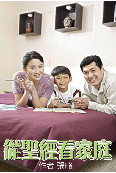
從聖經看家庭 作者 張略

信徒的家庭是建立在神人立約的關係上,也在神的家裏的支持下。在這婚姻和家庭正處於分崩離析的年代,我們有責任重申家庭作為立約關係的重要,並且以身作則,說明其現實性。