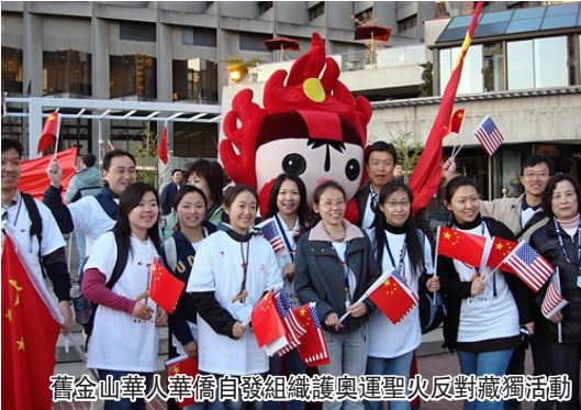
舊金山華人華僑自發組織護奧運聖火反對攔截活動

市長紐森和華裔警察局長方宇文日前會見媒體時表示，造成舊金山聖火傳遞路線臨時改道的主要原因，就是戴利組織人在聖火經過的大街上攔截並破壞巴士。