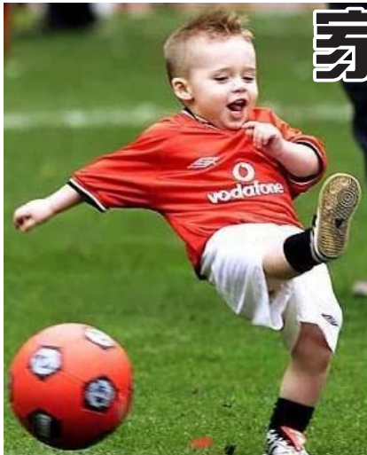
一.發現錯誤,應放手嘗試,忌大加譴責、恐嚇

失敗是成功之母,失敗可以積累經驗教訓。許多家長在孩子犯錯誤時,不失時機地大加譴責、恐嚇。其實,犯錯誤是很好的學習機會。這種做法的出發點是阻止孩子再犯同樣的錯誤,但這樣做常常會產生相反的作用。孩子們或因害怕受責備而不敢冒險,失去學習新技巧的熱情和膽量;或產生反叛心理,反其道而行之。如果處理得當,可以將犯錯誤