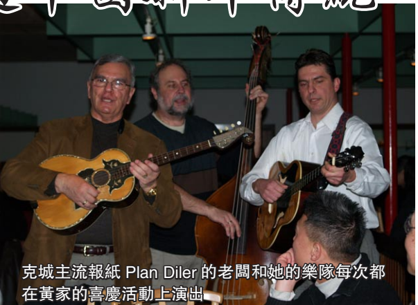
克城主流報紙 Plan Diler 的老闆和她的樂隊每次都在黃家的喜慶活動上演出

姥姥一篇阿里山論劍,轟動武林,引起島民一陣學武之風。天涯刀客,海角老大紅,黑道白道,紅男綠女,無不磨拳擦掌,要在阿里山神木下,大展展威,落實民拳。歌曰:路見不平一聲吼啊該出手時就出手。