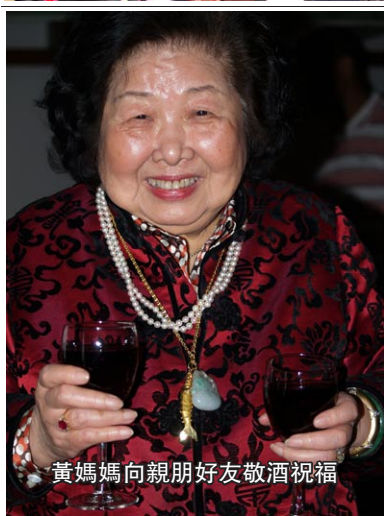
黃媽媽向親朋好友敬酒祝福